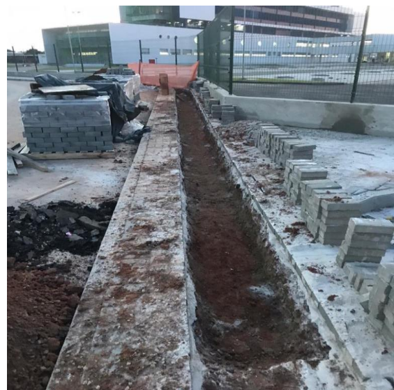
EXECUÇÃO DE ENTRADA DA REDE DE FIBRA ÓTICA