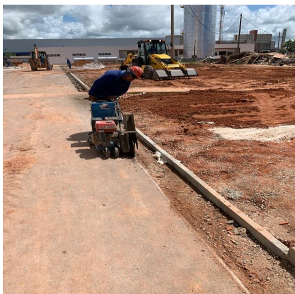
CORTE DO ASFALTO PARA EXECUÇÃO DE LINHA D'ÁGUA