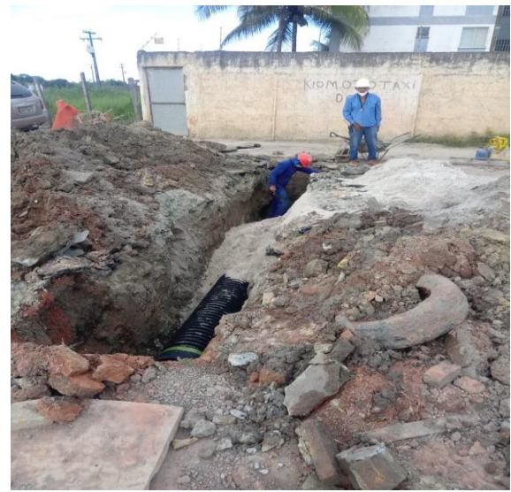
DESOBSTRUÇÃO DE DRENAGEM