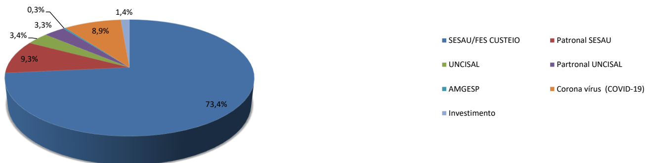
CONTROLE DE DESTAQUE FINANCEIRO PARA UNIDADES EXECUTORAS DE SAÚDE - FONTE 100 - ANO 2020