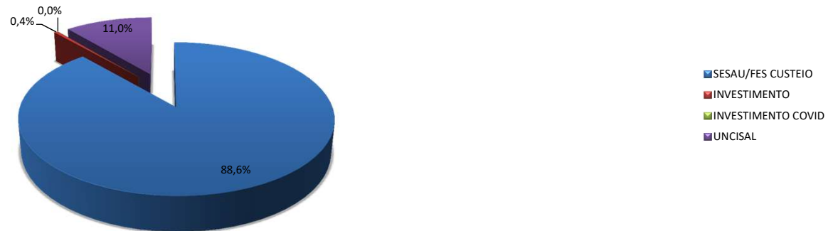
CONTROLE DE DESTAQUE FINANCEIRO PARA UNID. EXECUTORAS DE SAÚDE - FONTE 120 - ANO 2021