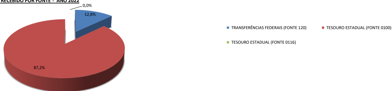
CONTROLE DE RECEITA RECEBIDO POR FONTE - ANO 2022