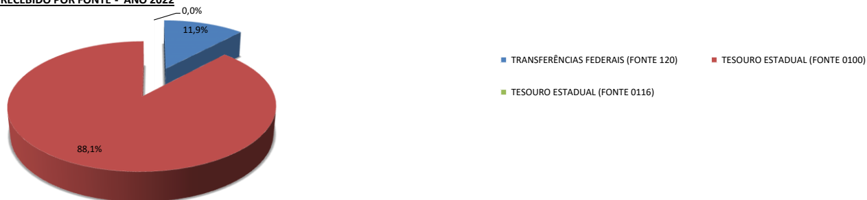
CONTROLE DE RECEITA RECEBIDO POR FONTE - ANO 2022