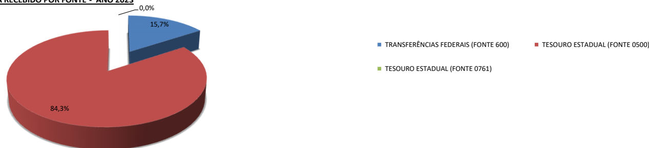
CONTROLE DE RECEITA RECEBIDO POR FONTE - ANO 2023