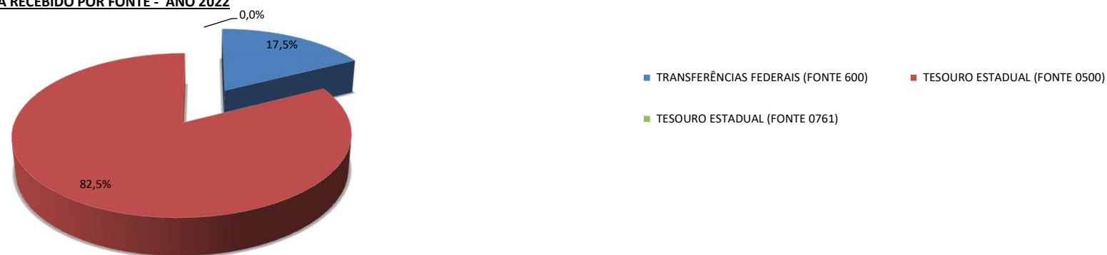
CONTROLE DE RECEITA RECEBIDO POR FONTE - ANO 2022