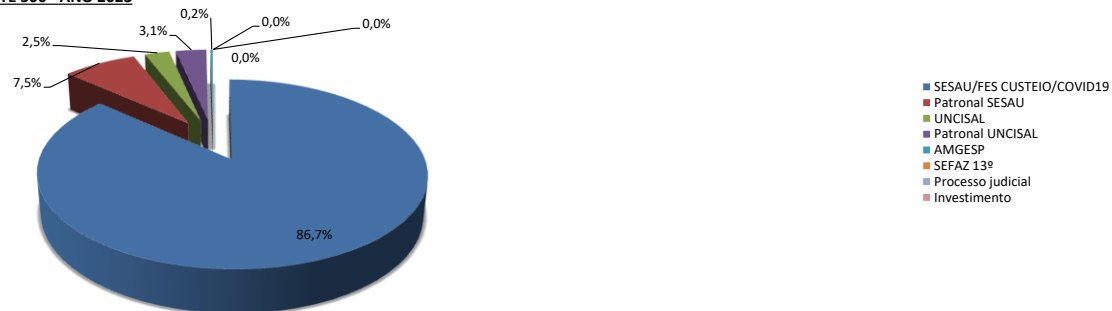
CONTROLE DE DESTAQUE FINANCEIRO PARA UNIDADES EXECUTORAS DE SAÚDE - FONTE 500 - ANO 2023