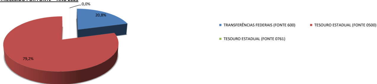
CONTROLE DE RECEITA RECEBIDO POR FONTE - ANO 2025